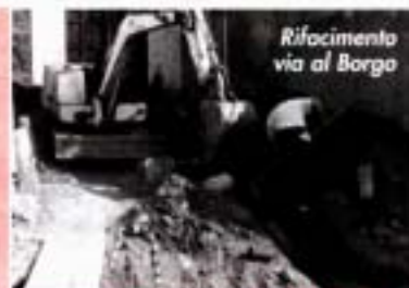
Rifocimento via al Borgo