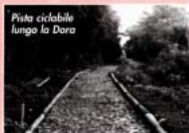
Pista ciclabile lungo la Dora