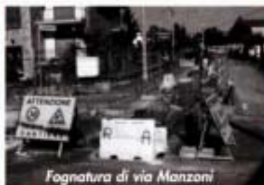
Fognatura di via Manzoni