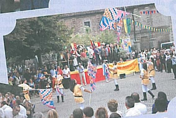
Gli sbandieratori di Pianezza