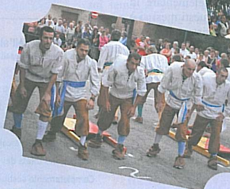
I "coreur" del Madonna della Stella vincitori del Palio dij Sèmma Sal 2007