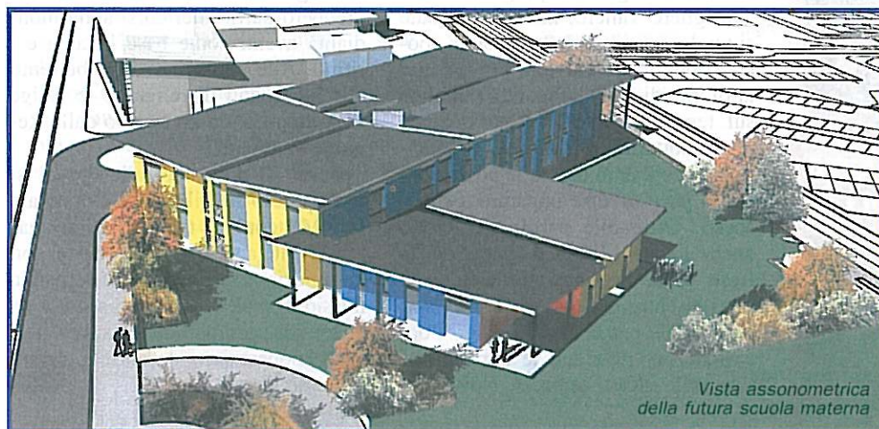
Vista assonometrica della futura scuola materna

Il 26 ottobre scorso si è tenuta un'assemblea pubblica per conoscere ed approfondire il progetto della nuova scuola materna da realizzarsi in via Pavese accanto alla scuola elementare Manzoni, così come peraltro già previsto fin dal 2002/3. Il Sindaco Gagliardi e l'assessore Rosso hanno illustrato e motivato la scelta effettuata nel contesto di un piano complessivo di interventi per TUTTE le scuole pianezzesi che parte da lontano. Occorre ricordare che il Piano Regolatore è del 1997 e nel 2001 con il neo eletto Sindaco Gagliardi si affronta in modo concreto l'esigenza di avere nuove scuole: prima di tutto "uscire" dalla Benefica , (locali impropri per