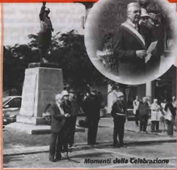
Momenti della Celebrazione

• 25 Aprile • Sessant'anni dalla Liberazione