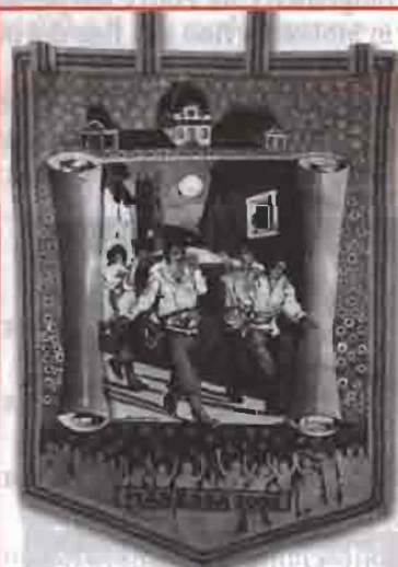
STENDARDO DEL PALIO DIJ SÈMNA-SAL 2005

La Giunta comunale ha approvato l'introduzione del Ticket Help per le famiglie che iscrivono i loro figli ai centri estivi. Si tratta di un contributo che viene assegnato alle famiglie con minori redditi e con maggiori difficoltà a pagare le attuali rette dei centri. Il finanziamento destinato ai Ticket Help è stato di 8.700.000. L'importo è di € 15 settimanale per ogni iscritto. L'intervento comunale a sostegno dei centri estivi ammonta a € 42.500,00 distribuito per circa l'80% in contributo ai centri e per il 20% direttamente alle famiglie.