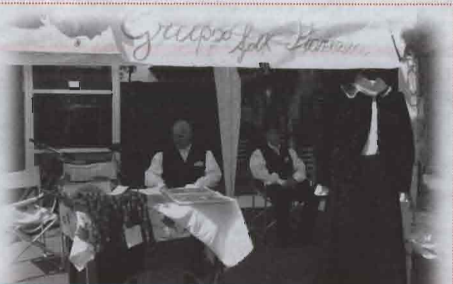
Gruppo Folk Pianezza con i suoi costumi