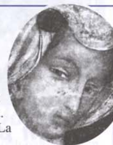
"Pieve di San Pietro - particolare dell'affresco attribuito a Giacomo Jaquerio"

"L'Auterdi", qualche giorno prima di ieri, un passato appena passato, una parola di uso comune dell'altro ieri. Il mattino dopo, finalmente, cielo è azzurro e il sole illumina la bianca corona di montagne.