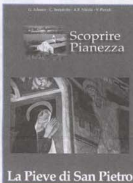
La Pieve di San Pietro