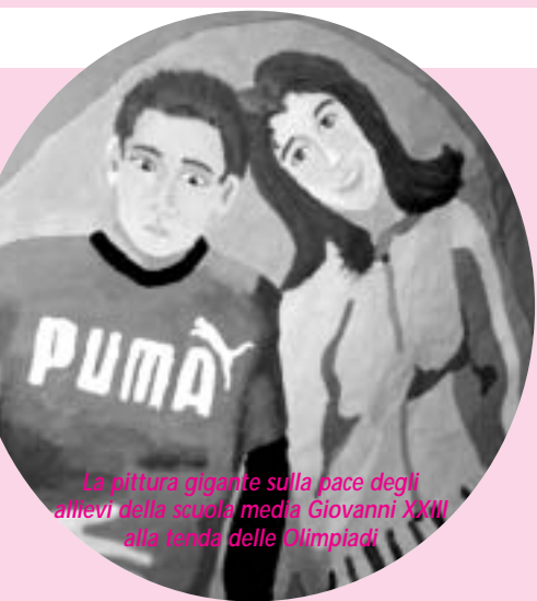
La pittura gigante sulla pace degli allievi della scuola media Giovanni XXIII alla tenda delle Olimpiadi