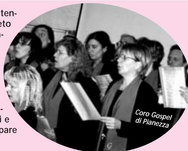
Coro Gospel di Pianezza

Ricco programma di serate sotto la tenda sistemata in Piazza Vittorio Veneto in occasione dei giochi olimpici. Il calendario di eventi ha accompagnato tutto il periodo delle olimpiadi con la visione su maxi schermo delle gare sportive. Gli incontri pomeridiani e serali sono stati gestiti dalle associazioni locali. Ricco il programma di musica, spettacolo, teatro, cori, proiezioni, concorsi, presentazioni di libri e tanto altro per incontrarsi e partecipare insieme all'evento olimpico.