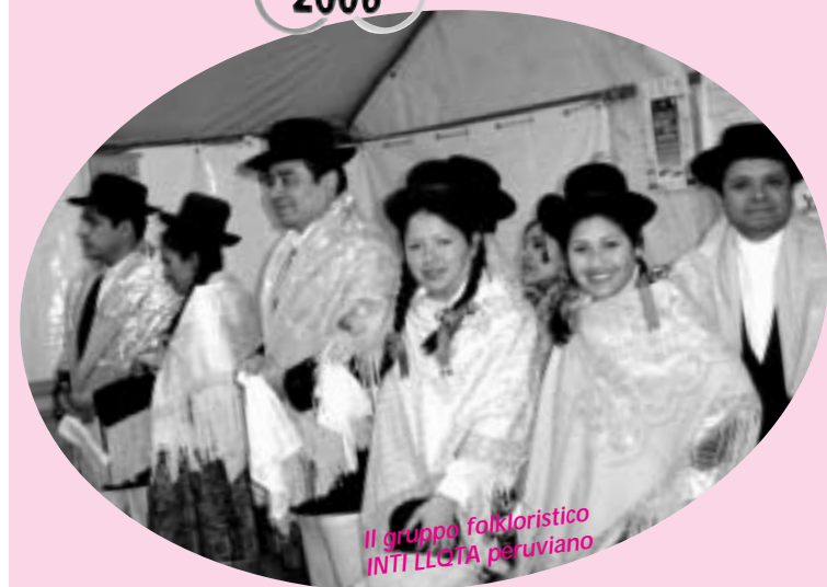
Il gruppo folkloristico INTI LLUTA peruviano